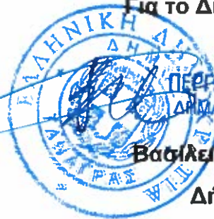
Βασιλείος Περγάλιας Δήμαρχος