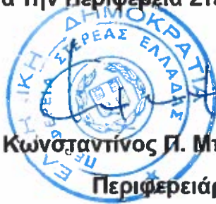
Κωνσταντίνος Π. Μπακογιάννης Περιφερειάρχης